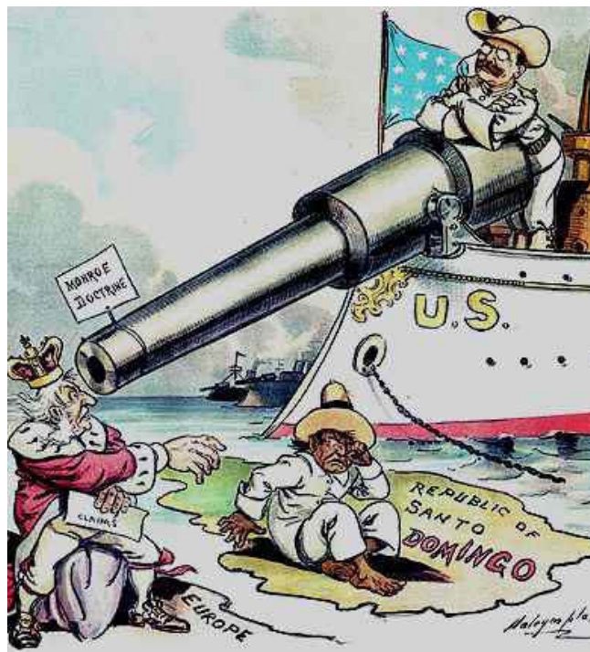
Caricatura que expresa la "defensa" de los territorios latinoamericanos por parte de la Doctrina Monroe.

Esta enmienda representó también, dos posiciones extremas en las relaciones del continente y las potencias a nivel mundial. La primer posición, estableció la intervención estadounidense como militarmente necesaria, de tipo neocolonial y extremadamente hegemónica en cada uno de los países latinoamericanos. La segunda por otra parte tendió a criticar y desconfiar de las intenciones de los Estados Unidos, al querer imponerse sobre las potencias de Europa, negar la posibilidad de independencia de los países del sur y cerrar los mecanismos y libertades económicas del continente.